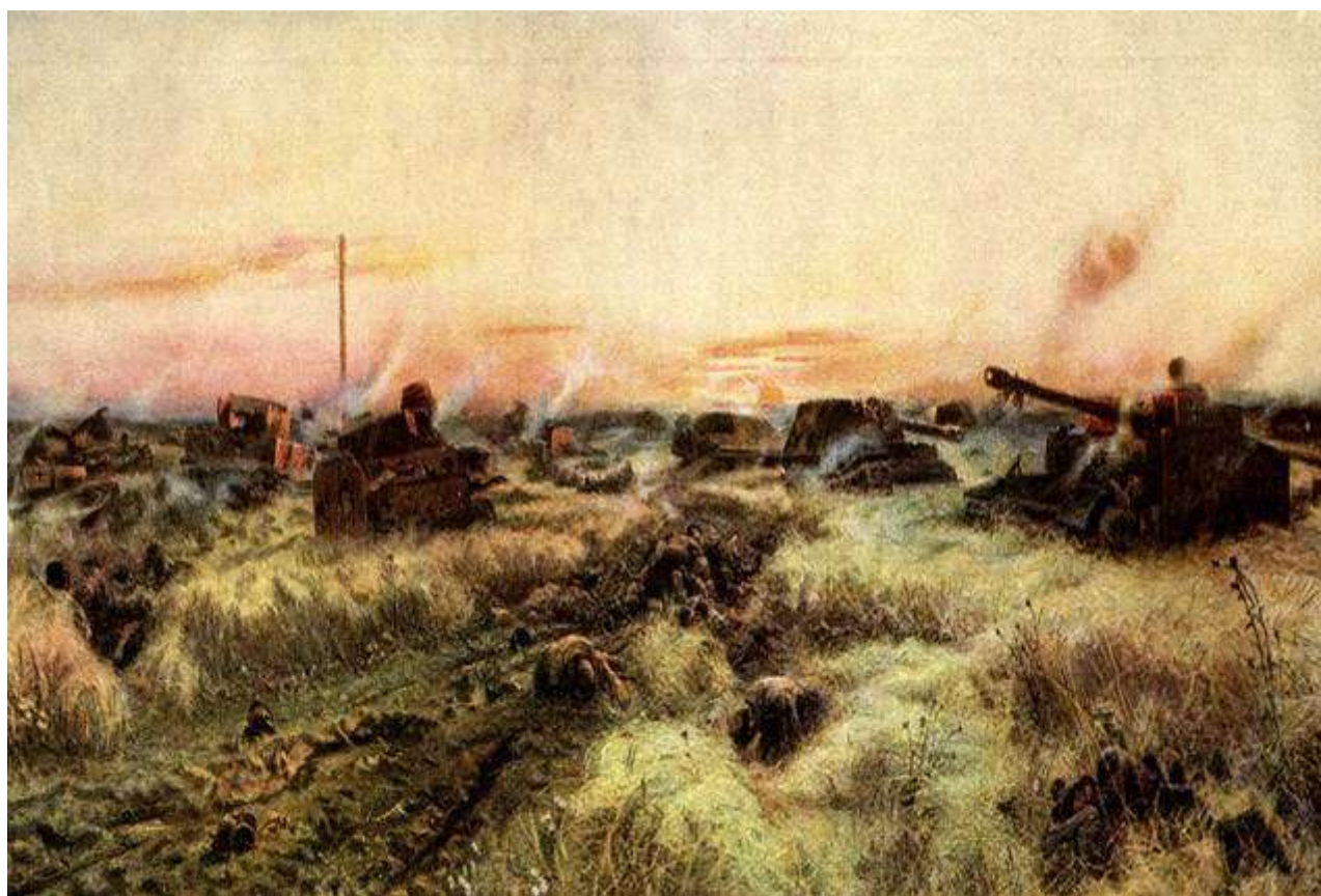
▪ На Курской дуге (фрагмент картины) 1943 .Автор П.А. Кривоногов.