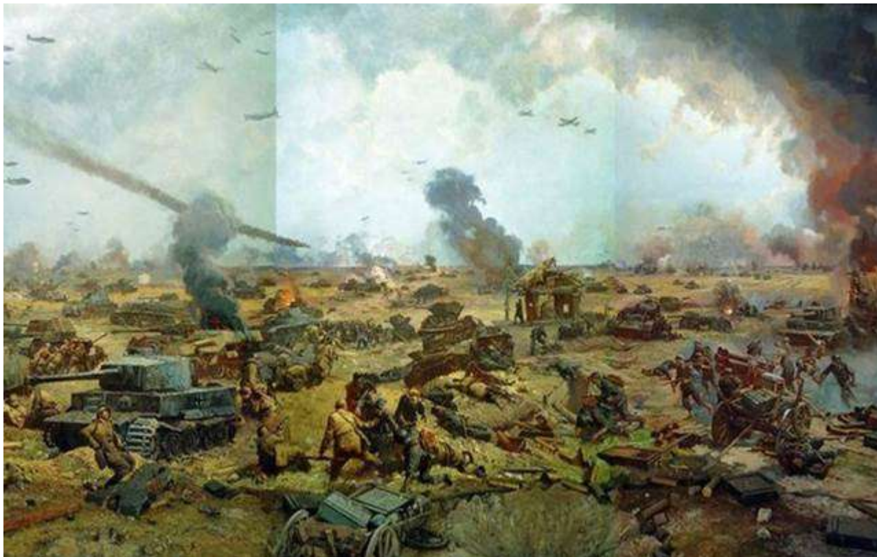
Битва за Прохоровку

В результате ожесточенного сражения в районе Прохоровки ни одна из сторон не смогла решить поставленные перед ней задачи: немцы — прорваться в район Курска, а советская танковая армия — выйти в район Яковлево, разгромив противостоявшего противника. Но путь врагу на Курск был закрыт. Противоборство двух группировок — наступавшей немецкой и наносившей контрудар советской — продолжалось вплоть до 16 июля, в основном на тех рубежах, которые они занимали. 16 июля начался отвод главных сил группы немецких армий "Юг" в исходное положение. 16 июля начался следующий этап Курской битвы — контрнаступление советских войск.