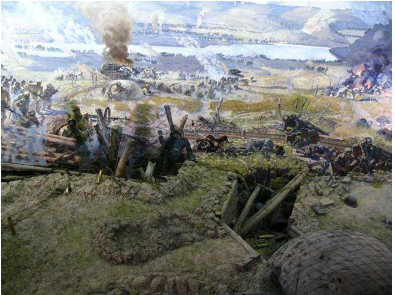
Орловская наступательная операция Диорама (фрагмент 3) Авторы Л. и А. Курнаковы, Г. Дышленко.

В августе 1943-го немцы сопротивлялись отчаянно. О том, чем они при этом руководствовались, свидетельствует текст опубликованного советским военкором Павлом Трояновским письма, найденного на теле погибшего под Харьковом немецкого ефрейтора, которое он так и не успел отправить домой: «Ничего так не жалко, как жалко оставлять Украину. Мы тут жили превосходно. Куры, гуси, сахар, молоко, сало — всего было вдоволь. А сколько мы мобилизовали отсюда восточных рабочих! Фюрер обещал наделить нас, ветеранов войны, земельными наделами на Украине. Земля и климат — прелесть. Тридцать—пятьдесят здешних гектаров плюс дешевая крестьянская сила обеспечили бы всей нашей семье радостную жизнь... Жаль, очень жаль уходить отсюда. Впрочем, говорят, что мы ещё вернемся, и я верю этому...».