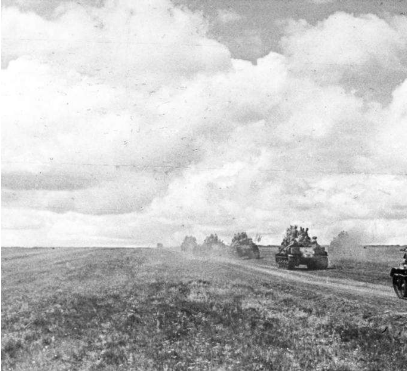
Битва на Курской дуге, 1943 год

В ходе зимнего наступления Красной армии и последовавшего контрнаступления вермахта на Восточной Украине в центре советско-германского фронта образовался выступ глубиной до 150 км и шириной до 200 км, обращенный в западную сторону, — так называемая Курская дуга (или выступ). Германское командование приняло решение провести стратегическую операцию на Курском выступе. Для этого была разработана и в апреле 1943 года утверждена военная операция под кодовым названием Zitadelle ("Цитадель"). Для