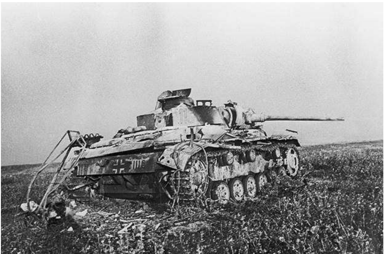
Подбитый фашистский танк в районе станции Прохоровка в ходе сражения на Курской дуге в 1943 году.

Продвинувшиеся в полосу Воронежского фронта, примерно на 35 немецкие войска армии «Юг» под командованием Эриха фон Манштейна так и не смогли прорвать советскую оборону, и перешедшие в контрнаступление