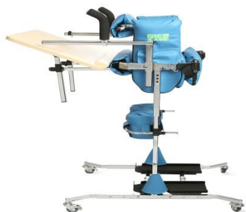
Ходунки различных модификаций